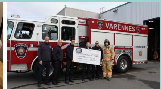
Club social des Pompiers de Varennes