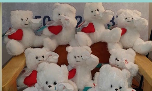
Résidences funéraires Mongeau